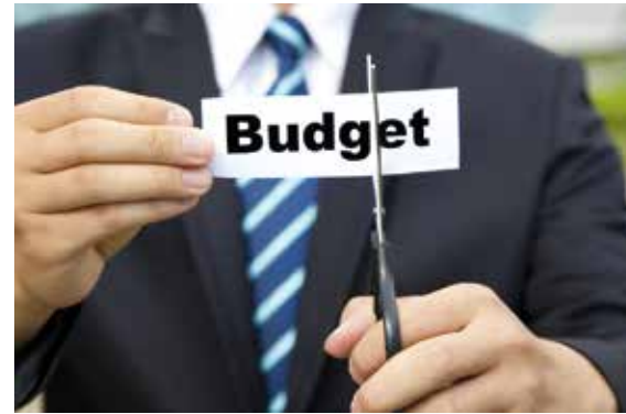
LOKALE BESTUREN HALLE-VILVOORDE MOETEN FORS INLEVEREN