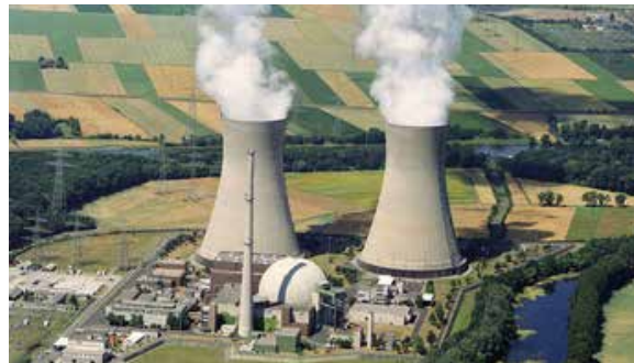
Bijschrift foto's kan vanzelfsprekend. Kwestie is van ook daar een fijne aanvullende tekst te krijgen

De levensduurverlenging van de kerncentrales Doel 1 en 2 die door de federale regering is beslist, zet de Vlaamse investeringen in hernieuwbare energie op de helling. Daarom vraagt de sp.a-fractie in het Vlaams parlement een belangenconflict in te roepen tegen de federale wet.