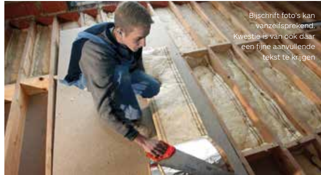
Bijscrift foto's kan vanzelfsprekend. Kwestie is van ook daar een fijne aanvullende tekst te krijgen

Lorem ipsum dolor sit amet, consectetur adipiscing elit, sed do eiusmod tempor incididunt ut labore et dolore magna aliqua. Ut enim ad minim veniam, quis nostrud exercitation ullamco laboris nisi ut aliquip ex ea commodo consequat. Duis aute irure dolor in reprehenderit in voluptate velit esse cillum dolore eu fugiat nulla pariatur. Excepteur sint occaecat cupidatat non proident, sunt in culpa qui officia deserunt mollit anim id est laborum sunt in culpa qui officia deserunt.