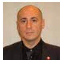
foto (minstens 300 resolutie)

meer info naam, functie en contactgegevens