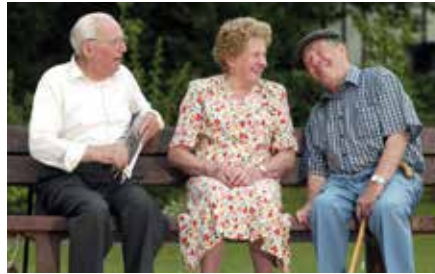
Bijschrift foto's kan vanzelfsprekend. Kwestie is van ook daar een fijne aanvullende tekst te krijgen